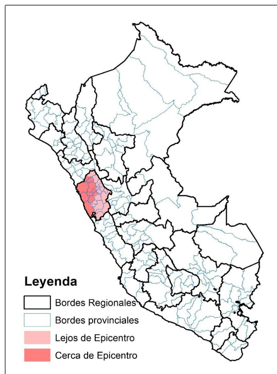
Mapa 1. Ubicación de la zona tratada en el estudio

Donde los elementos son los mismos, pero el tratamiento T_i es dividido en dos grupos, Cerca_i y Lejos_i , que son variables dicotómicas que toman el valor de 1 si el distrito está en Ancash, cerca o lejos al epicentro del terremoto, respectivamente. En el Mapa 1 y Mapa 2 se presenta la distribución de ambos grupos en relación al país y en relación a la región Ancash, respectivamente.