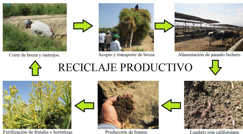
Figura 5. Reciclaje de desechos fincas hortofrutícolas, Costa Norte-Perú

Respecto al mulch observado en campos de palto, Ureña (2009) , señaló que, el uso de residuos de poda en la plantación ayuda a evitar la erosión hídrica por lluvia, además de aportar un ambiente propicio para que microorganismos y lombrices se reproduzcan, lo cual redunda en múltiples beneficios para el cultivo. De manera similar, se ha observado en la costa norte de Perú (figura 5), que empresas dedicadas a la producción de frutas para exportación, han optado por incorporar en sus sistemas productivos ciclos de reciclaje de rastrojos vegetales, teniendo múltiples aplicaciones, como la alimentación del ganado, producción de fertilizantes para luego estos retornar a los cultivos.