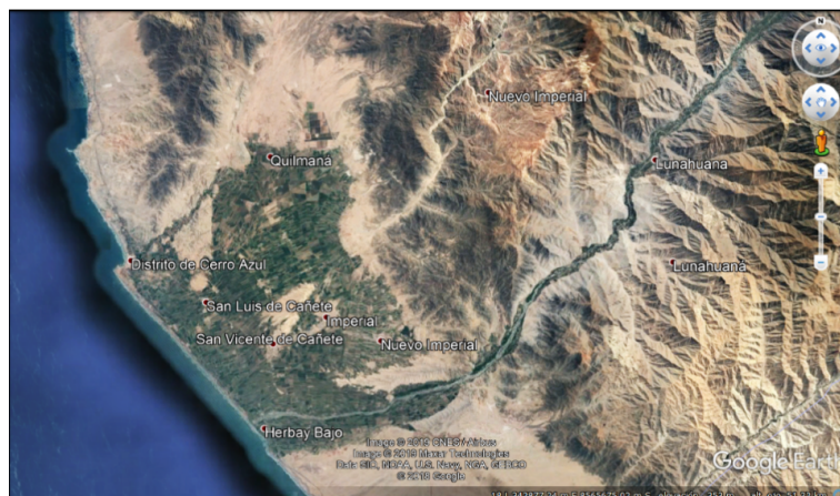
Figura 1. Valle de Cañete, Lima-Perú.

El estudio se realizó en el Valle de Cañete, Lima-Perú ( 13^{\circ}04'42''S 76^{\circ}23'02''O ), en los distritos de San Luis, San Vicente, Nuevo Imperial, Imperial y Quilmaná (figura 1). La población objetivo correspondió a fincas productoras de palto y mandarina registradas en la Asociación de Productores de Cañete ( N = 55 ). Para determinar el tamaño de la muestra, se empleó el método de proporciones recomendado por Julca et al. (2006), el cual dio como resultado 48 fincas escogidas al azar.