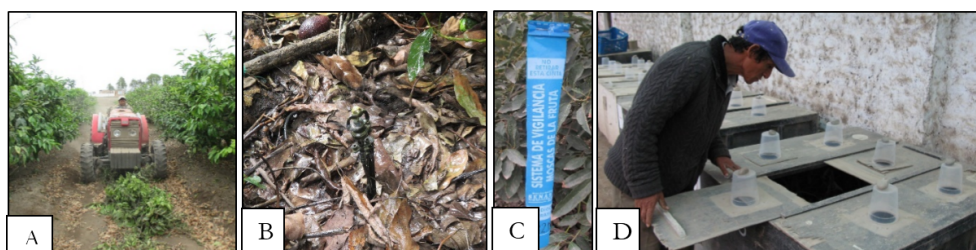
Figura 4. Manejo de residuos de cosecha en Cañete: A) Trillado e incorporación al suelo; B) Mulch; C) SENASA supervisa el entierro de frutos de descarte; D) Cámara de recuperación de parasitoides.