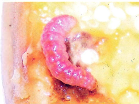
Figura 2. Larva de N. elegantalis

El daño producido por N. elegantalis es por la destrucción de los frutos, porque la larva se alimenta dentro de estos (Figura N° 2), lo que provoca la pérdida de la calidad de los frutos, coincidiendo con Fernández y Salas (1985), Salas et al (1991) y Espinoza (2008) informan que es suficiente que una sola larva salga del fruto, para que este se pudra totalmente.