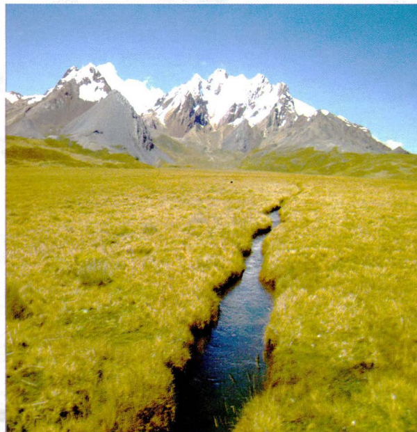
Figura 4. El humedal de Quyoq que filtra el agua que ingresa por la parte alta del proceso de retroceso del glaciar de la Cordillera Queullaraju, ubicada aproximadamente a una altitud de 4250 m.s.n.m.

El agua que ingresó al humedal después de haber recorrido 3 Km por debajo del humedal sale tratada naturalmente, de color cristalino que es utilizada para consumo humano y riego de pastos naturales del sector Pampajallca.