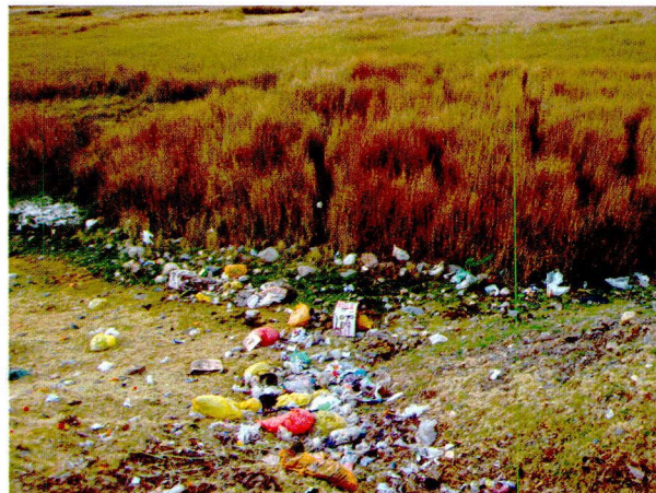
Figura 6. Residuos sólidos domésticos arrojados en el humedal de Yanayacu, aproximadamente a una altitud de 3500 m.s.n.m. Alrededor destacan plantas de totora, 2009.

Las actividades domésticas: Los residuos sólidos domésticos producidos en la ciudad de Cátac son vertidos directamente al humedal Yanayacu.