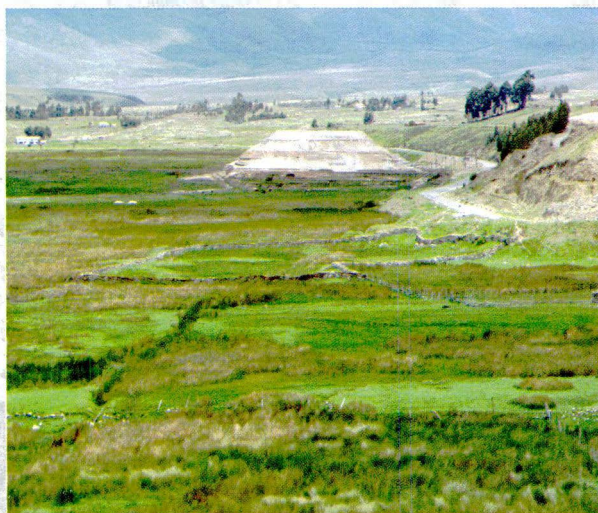
Figura 5. Contaminación del humedal de Yanayacu con relaves mineros provenientes de Mesapata-Cátac.

Las actividades mineras: Las Plantas Concentradoras de Minerales ubicadas en Mesapata y en San Miguel son las que vierten los relaves mineros en los humedales de Yanayacu y San Miguel, deteriorando los ecosistemas de los humedales.