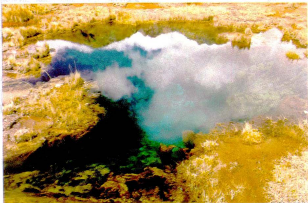
Figura 3. Laguna de Pumapashimin, posee fuerzas telúricas y cósmicas, ubicada en Pumapampa, aproximadamente a una altitud de 4000 m. s. n. m.

Valor de existencia: Está ligado estrechamente a los valores culturales y hasta religiosos de los mismos comuneros. Los humedales representan un invaluable patrimonio cultural por su significado espiritual y religioso, son importantes espacios de vida y de riqueza cultural andina, fecundos en simbolismos, mitologías y valores.